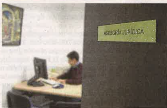
Asesoría jurídica de Fundación DFA.

Durante 2019, Fundación DFA atendió 356 citas presenciales relacionadas con materias sobre discapacidad como altas médicas, determinación de contin-