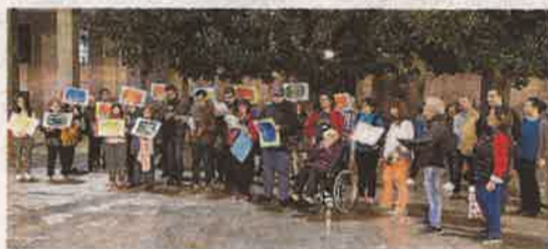
Acto de reivindicación política de usuarios de Plena inclusión Aragón, antes de las últimas elecciones.

En nuestra comunidad autónoma, esta organización está representada por Plena inclusión Aragón.